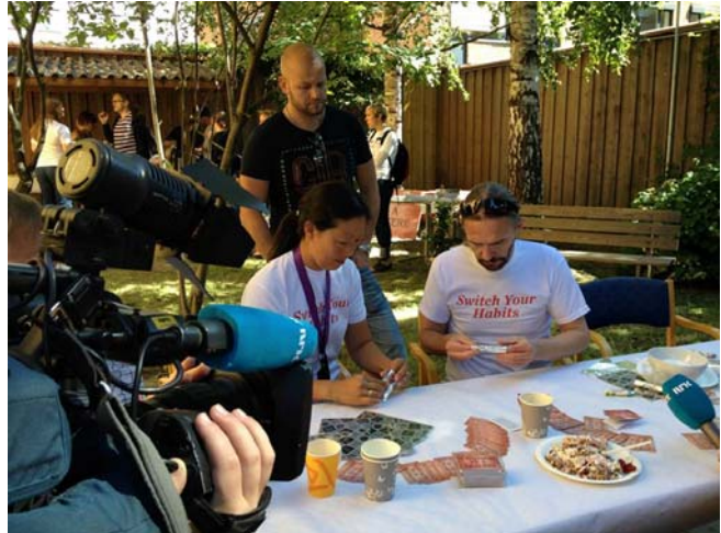
Torstein viser hvordan heroin røykes, for sprøyterommets leder og Utekontakten.

Hordaland FHN har igangsatt betydelig oppsøkende virksomhet og utdeling av skadereduksjonsartikler, i Bergen.