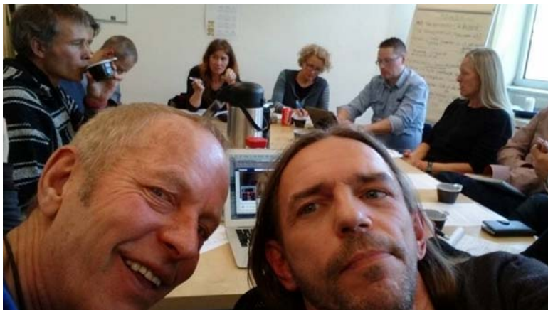
Martindale metadon-møte hos FHN.

21. mars: FHN inviterte Helsedirektoratet og øvrige brukerorganisasjoner til møte hos oss om Martindale metadon.