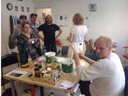
Pakking av askorbinsyre på kontoret.

Det at vi har midler til så få stillingsprosjenter, medfører at vi taper mengder av frivillig innsats, fordi vi ikke har folk til å ta seg av de som ønsker å aktivisere seg. Foreningens drift preges av disse utfordringene. Men i 2014 har FHN fått god tilførsel av aktive på kontoret på Arbeidersamfunnets Plass.