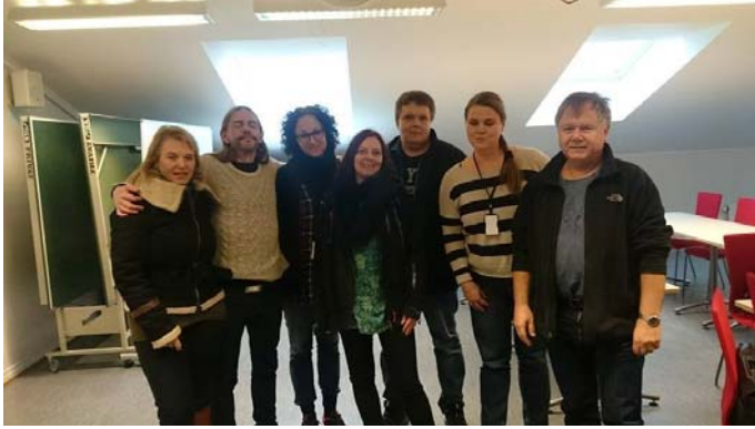
Torstein hos Prindsens Mottakssenters brukerråd.